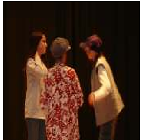
Spass und Talent auf der Bühne.

Eltern und Freunde eingeladen. Wir wollten Ihnen zeigen, was wir alles gelernt hatten und wie viel Talent wir haben. Wer wollte, konnte selbstverständlich mitmachen.