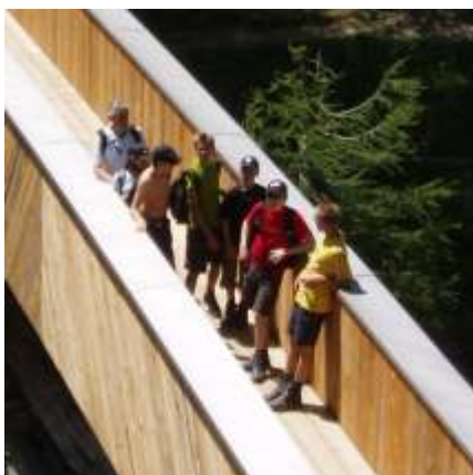
Wandern im Nationalpark