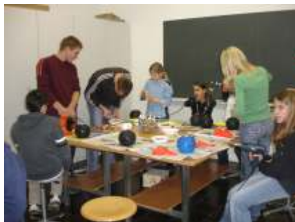
Grosse Bastelei für die Liebsten.

wurden und Seifen, die man selber giessen, färben und mit Duft versetzen