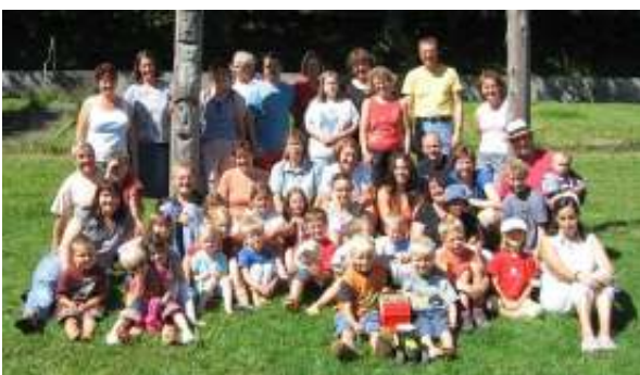
Die gutgelaunte Familien-Lager-Bande

Vom 15. - 18. August fand das Familienlager statt. Dieses Mal in Wildhaus im Toggenburg.