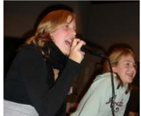
...die Girls singen!

terspezifischen Rahmen zu haben, bei dem verschiedenste Dinge besprochen werden können. ■