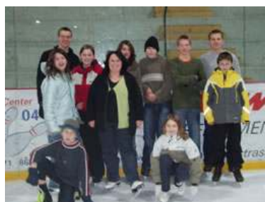
Viel Spass auf Eis!

Passend zur Jahreszeit haben wir uns also nach Wetzikon aufgemacht, um in der Eishalle Schlittschuh zu laufen! Naja, „passend zur Jahreszeit“ ist vielleicht ein bisschen hoch gegriffen... der Winter hatte