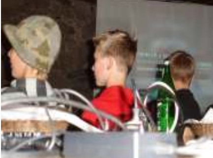
Die Jungs gamen auf Grossleinwand.

Die Grösse des Team erlaubt es uns zum ersten Mal, einen Anlass für Jungs und Mädels getrennt anzubieten, was toll ist!