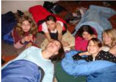
Trotz später Stunde hellwach!

Fast die ganze Nacht haben 15 Uner-schrockene ein Ge-spenst gejagt, wel-ches zwei Unschuld-ige aus ihrer Mit-te gerissen hatte. An verschiedenen Pos-ten gab es gruslige Aufgaben zu lösen, die einen weiteren