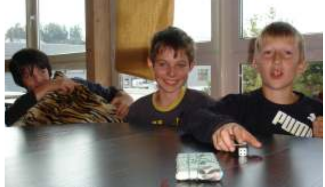
Partyspiele machten Stimmung am Willkommensanlass

unser Homepage www.vitamin-x.ch ansehen! ■