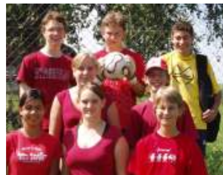
Die Grümipi-Truppe vor der 2. Runde

Obwohl wir nicht für ein einziges Training Zeit fanden, waren wir dieses Jahr erfolgreicher als je zuvor! Wir haben es zum ersten Mal in die zweite Runde geschafft - Juhuiiiii!!! ■