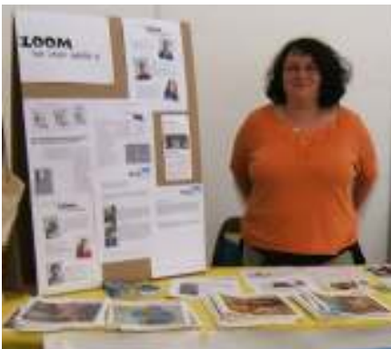
ZOOM in Genf vorstellen

Dieses Jahr hat die DEZA und das seco den Jugendwettbewerb „We care, you too?“ ausgeschrieben. Vitamin-X war mit seinem Projekt ZOOM dabei.