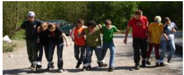
Welches Team hat die Nase vorn?

Das ist ein ziemlich wildes Spiel und erlaubt mal so richtig Dampf abzulassen. Die folgenden Spiele waren dann eher im Team zu lösen. Jedenfalls waren am Schluss alle noch unverletzt aber ausgepowert! ■