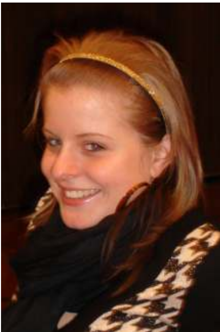
Dési leitete die Theaterabende mit.

Nach den Weihnachtsferien trafen wir uns sechs Wochen lang, jeden Dienstagabend im Kirchengemeindesaal. Überrascht waren wir, als sich acht Jugendliche zwischen der 6. Klasse bis sogar dem 10. Schuljahr anmeldeten.