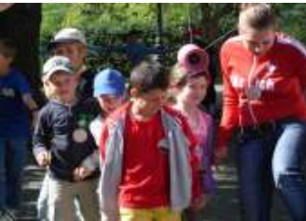
Die traditionelle Kinderschlange auf dem Vorplatz

Mit 60 Kindern und 40 freiwilligen HelferInnen sind die Ki-Ta-Ki jedes Jahr ein beliebter und toller Grossanlass.