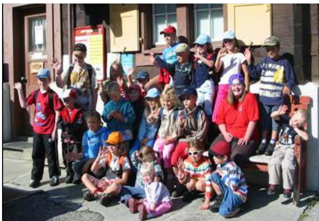
Die kunterbunte Familienlager-Kinderschar

Die Trainer des Teams und alle Beteiligten durften stolz sein.