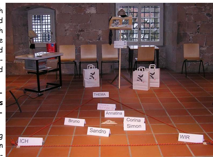
PACE-Kurs 1 - Das Team arbeitet an seinen Kompetenzen