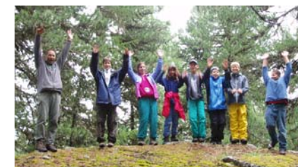
Erlebnis Wald - Infos und Action

Vom 16. - 20. Juli 2005 fand unser Teenie-Lager statt. Weil wir nach Celerina / GR reisten, nannten wir es „Bella Engadina“.