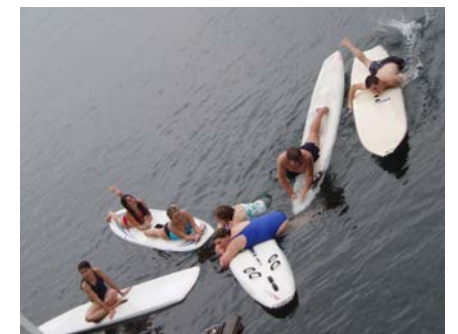
Neben Arbeit auch Badeplausch

...spannend, weil wir in einer wilden Verfolgungsjagd Mr. oder Mrs. X durch London gehetzt haben. Dabei gab es