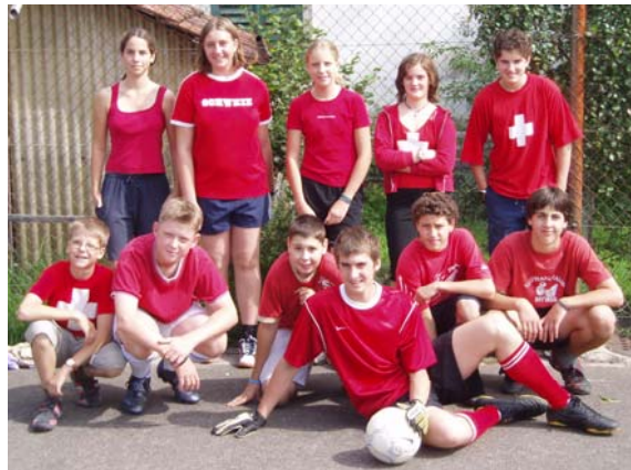
Schlagkräftige Mannschaft am Grümpi 2005

fehlen. Entspannend und gesund waren auch die verschiedenen Ateliers, die angeboten wurden: Von Kinesiologie, über Aerobic und MuKi/VaKi-Turnen bis hin zu Flieger basteln, Kneippkuren oder Massage war alles vorhanden, was Geist und Seele wohl tun kann. Ein schöner Abschluss für die Sommerferien 2005!