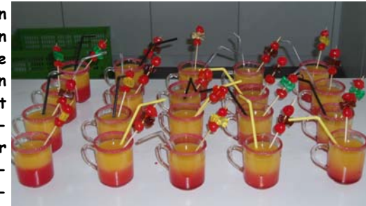
Zur Begrüssung einen Willkommenscocktail

Dieses Jahr durfte ich fast 20 „neuen“ Kids einen Brief schreiben, Vitamin X vorstellen und sie zu einem Willkommensanlass mit den