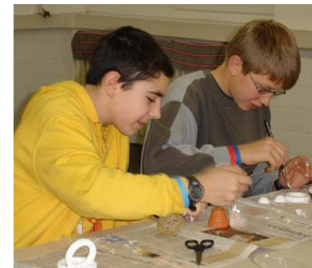
Auch so entstehen Schneemänner

Die toll ausgerüstete Freizeitwerkstatt war für unsere Zwecke perfekt. Fünfzehn Kids bastelten und werkten an ihren Weihnachtsgeschenken. Zur Auswahl stand: Eine befüllbare Wanduhr, eine Futterstation für Meisli in Form eines Schneemannes, Kleenex- und andere Schachteln mit Serviettenteknik dekorieren und das Basteln von Drahtsternen. Letzteres fand keinen Anklang, dafür waren die Resultate der